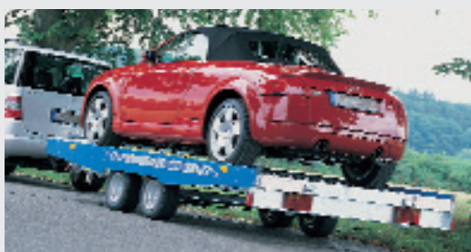
Auto- und Motorradtransporter