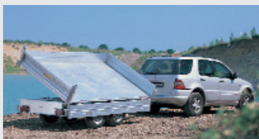
Rückwärts- und Dreiseitenkipper