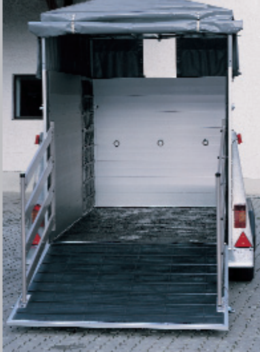
Abb. Mitte Modell 7911 Zubehör: Treibgitter beidseitig an der Auflaufklappe