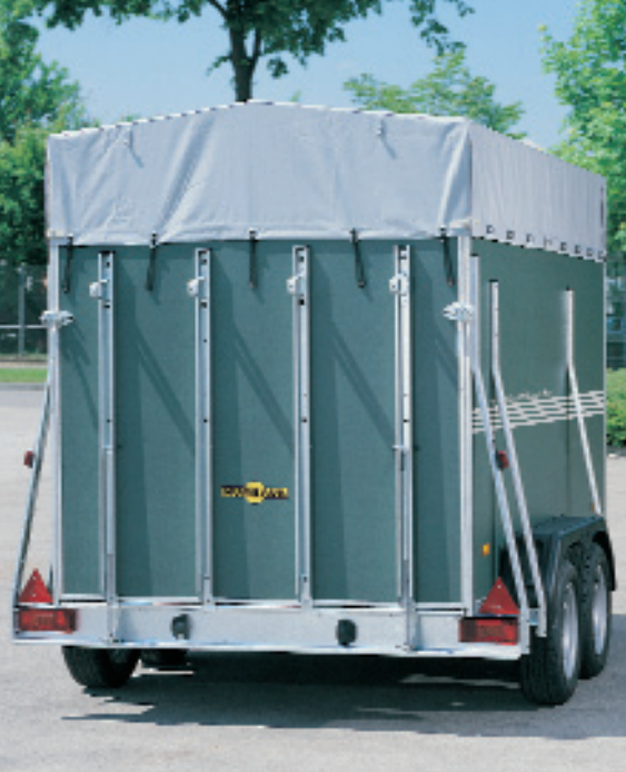
Abb. oben Modell 7909 Zubehör: Plane und Spriegel 350 mm mit Sprengung