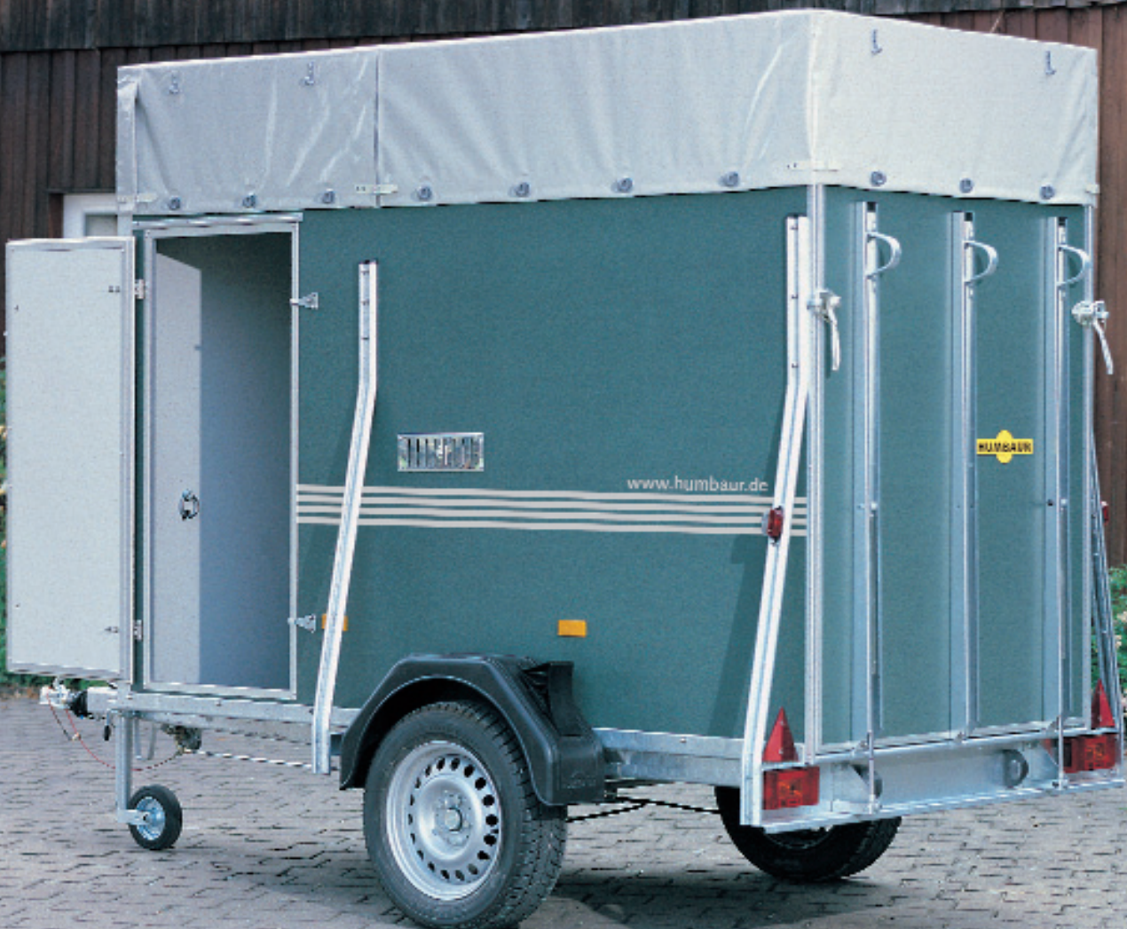
Abb. unten Modell 7907 Zubehör: Plane und Spriegel 350 mm hoch, Lüftungsschieber