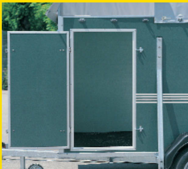
Abb. oben Modell 7906 Zubehör: Flachplane