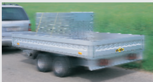
Tandemanhänger (Hoch- und Tieflader)