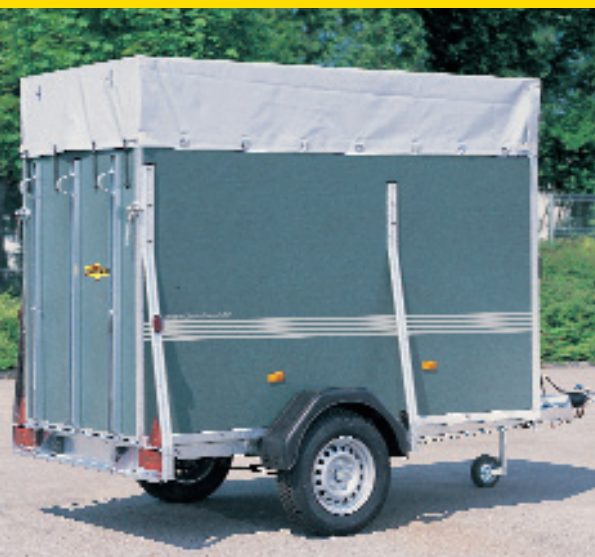
Abb. unten Modell 7907 Zubehör: Plane und Spriegel 350 mm hoch