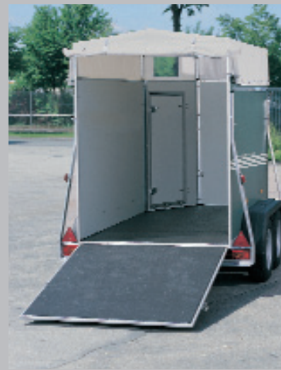
Abb. alle Bilder Modell 7908 Zubehör: Plane und Spriegel 350 mm hoch mit Sprengung und Lüf- tungsmöglichkeit, Frontausstieg in Fahrtrichtung rechts