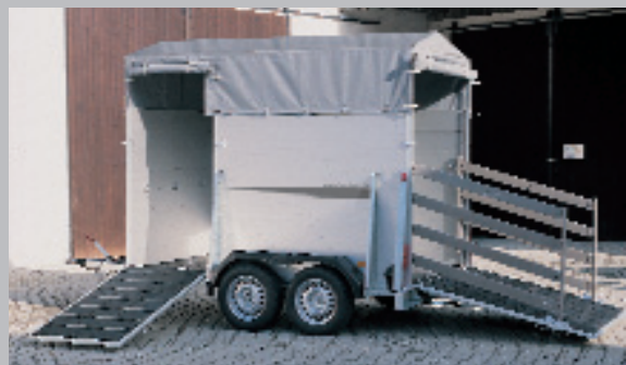
Abb. rechts Modell 7911 Zubehör: Treibgitter beidseitig an der Auflaufklappe, seitliche Lüftungsklappen