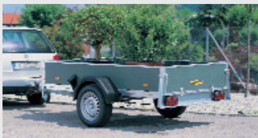
Einachsanhänger (Hoch- und Tieflader)

Internet: www.humbaur.de E-mail: info@humbaur.de